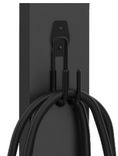
Crochet de câble

Installation sûre et sécurisée sur des surfaces irrégulières