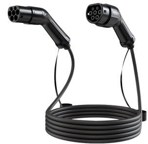
Câble de chargement 7kW/22kW

Pour l'équilibrage dynamique de la charge et la recharge solaire