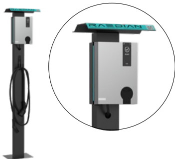
Basamento con tetto

5m/7,5m, da Tipo 2 a Tipo 2 Include una borsa per il trasporto