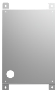
Supporto a parete

Per il montaggio della stazione di ricarica