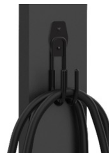
Gancio per cavi

Installazione sicura e stabile su superfici irregolari