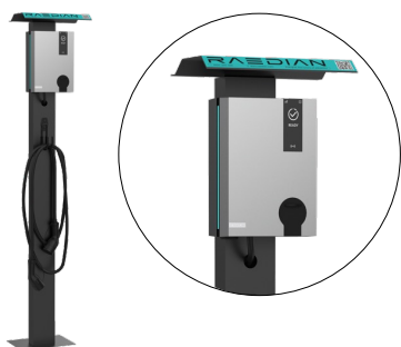
Basamento con tetto

5m/7,5m, da Tipo 2 a Tipo 2 Include una borsa per il trasporto