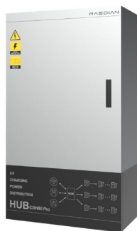
ECPC HUB 80A/160A/250A

RCD Tipo A, SPD Tipo I+II, IP65, Misurazione MID